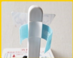
ノズル固定部分、下から見たところ